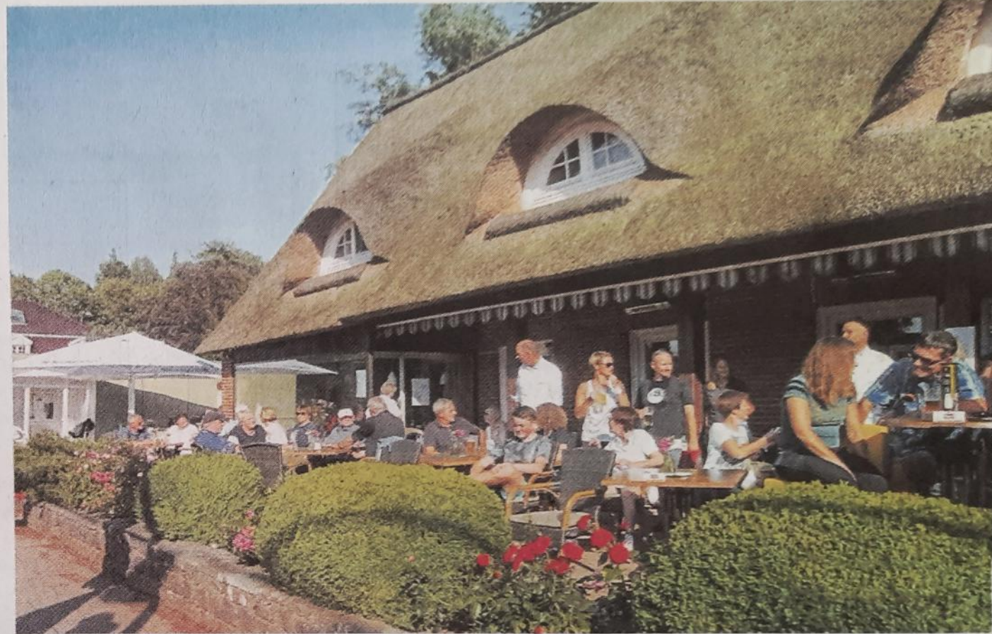
Idyllisch: Die Clubhaus-Terrasse im Sommer.

Die Zeiten, als er auch sportlich die Szene im Land dominierte, liegen allerdings ein wenig zurück. In den 1970er- und 1980er-Jahren spielten die Herren um ihre Spitzenspieler Heiko Wode und Thies Röcke ganz oben mit, erreichten sogar die Aufstiegsrunde zur Bundesliga. Die Top-Ereignisse in der Geschichte des „Lawn“ waren aber die Erfolge von Michael Stich, der aus der eigenen Jugend stammt. Die